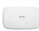
MÓDULOS DE APARATOS/LÁMPARAS